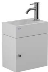
Conjunto mueble con lavatorio YL15A BB