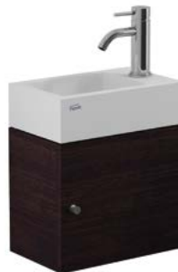
Conjunto mueble con lavatorio YL15A B7