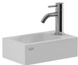
Lavatorio L15K B