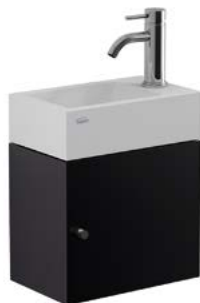
Conjunto mueble con lavatorio YL15A BN